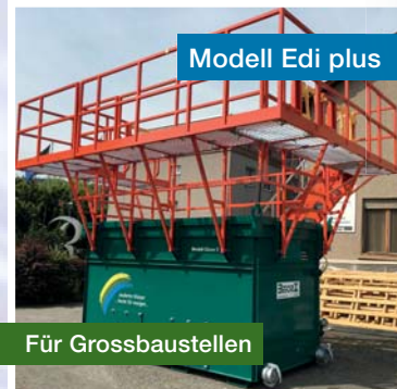
Modell Edi plus